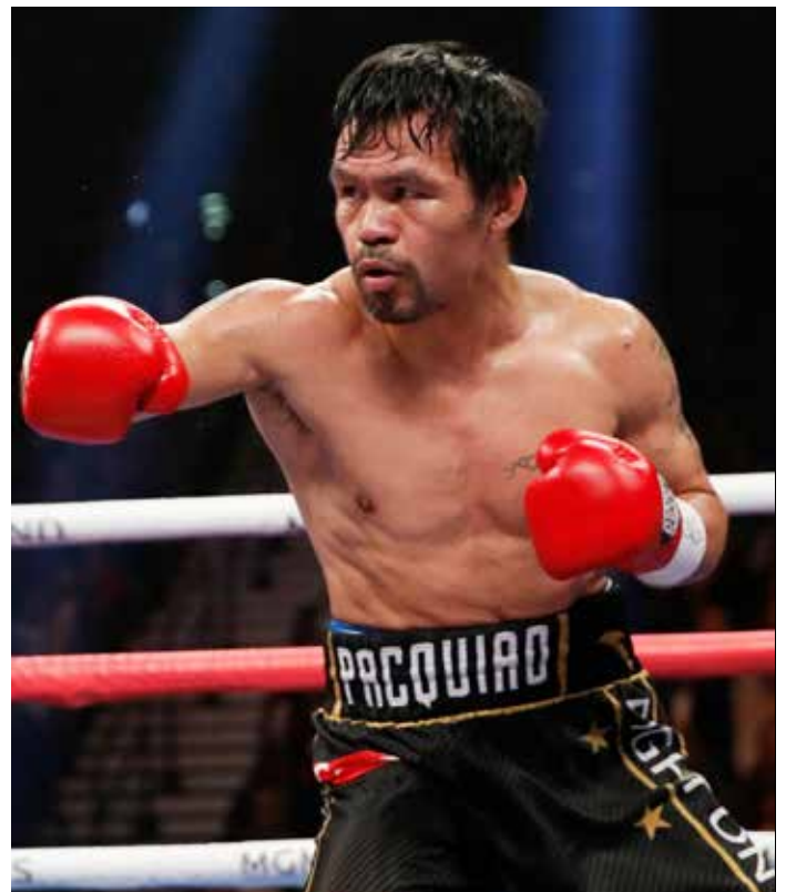
“Mani Pacquiao, Ex-Boxeador