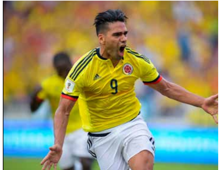
Radamel Falcao García, Futbolista Colombiano

Son deportistas que han optado por llevar una vida sana y que ven en su credo el mejor camino a seguir, muchos mantienen su gran éxito gracias a que han encontrado un equilibrio adecuado entre ambas cosas.