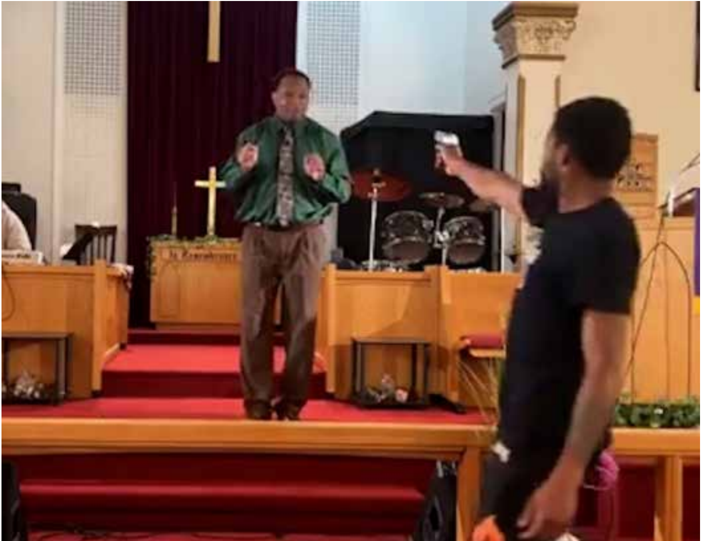
Fotografía Noticias Telemundo (fotograma)