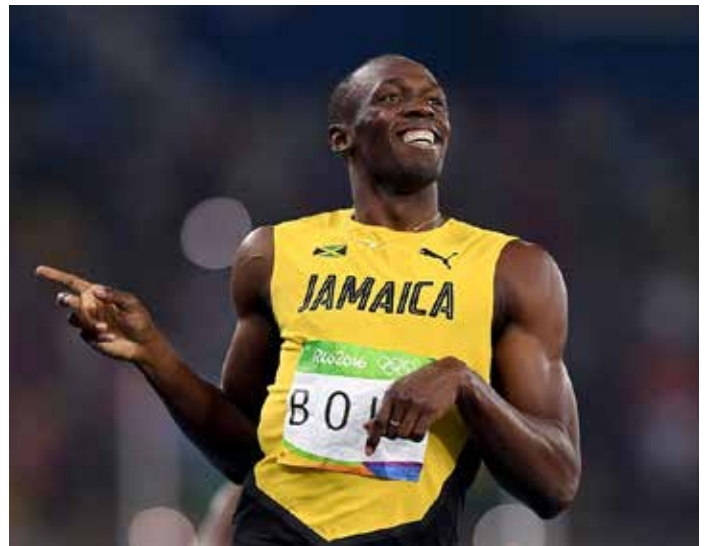
Usain Bolt, El atleta más rápido del mundo