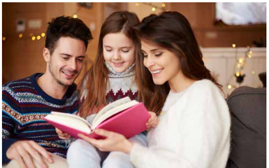
Fotografía “Banco Freepik”